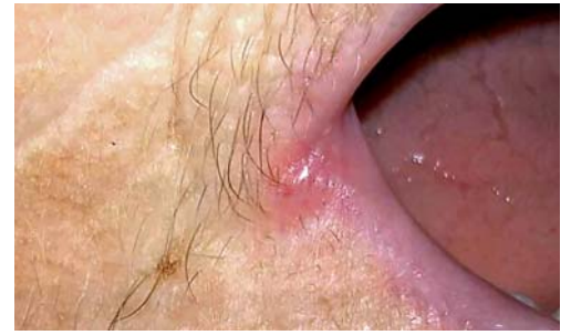
Abb. 2: Mundwinkelrhagade bei einer 83-jährigen Patientin mit Mundtrockenheit.

Die Therapie der Mundtrockenheit erweist sich durch die breit gefächerte Ätiologie dieser Symptomatik als sehr individuell. Patienten, die unter der Erkrankung leiden, klagen zudem in einem Großteil der Fälle erst bei einer über 50-prozentigen Verminderung der Speichelflussrate über den Mangel des Speichels (Dawes, 2004). Im Hinblick darauf sollten die Erkennung, die Dokumentation und die Recherche nach den