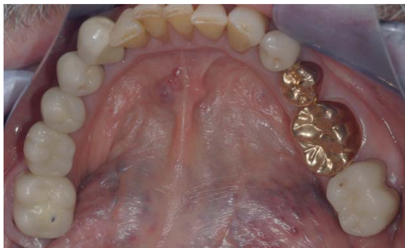
Abb. 1: Patient mit fehlendem „Saliva pooling“ aufgrund von Mundtrockenheit.

Die Auswertung der im Anamnesebogen integrierten Fragen kann mittels der „Likert-Skala“ durchgeführt werden, welche in drei Stufen unterteilt ist. So gilt für die Beantwortung der Fragen mit einem „nie“ der Wert 1, für die Beantwortung „ab und an“ der Wert 2 und für die Beantwortung „oft/häufig“ der Wert 3. Für die Auswertung der Fragestellungen wird der Wert in der Summe gerechnet, um den Grad der subjektiven