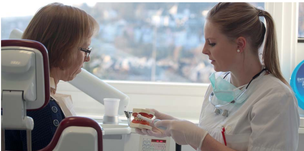
Abb. 3: Patientenorientierte Motivation und Instruktion.

Tritt die Mundtrockenheit im Zusammenhang mit xerogenen Medikamenten auf, so kann eine Umstellung oder Dosisreduktion der Medikamente zu einer deutlichen Verbesserung der Symptomatik führen. So beschreibt etwa Scully (2003), dass im Vergleich zu den trizyklischen Antidepressiva die Serotonin-Wiederaufnahmehemmer eine weniger xerogene Wirkung haben sollen (Scully, 2003). Schwierig wird es in den Fällen