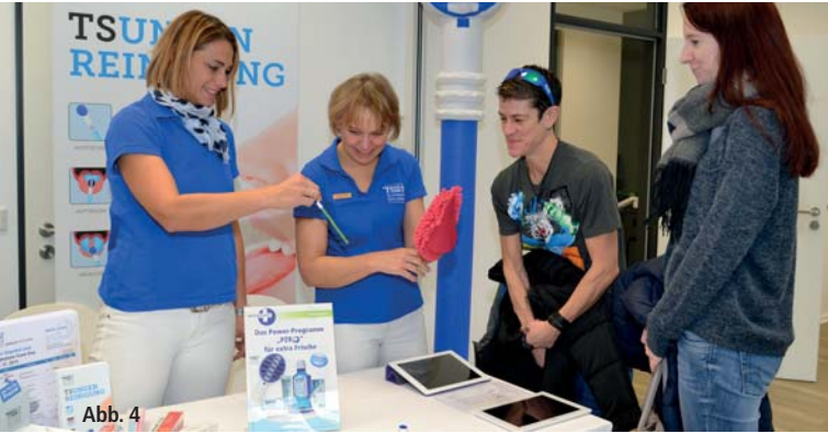
Abb. 3: Bereits zu Beginn des Vortragstages war im Auditorium kein Platz mehr frei. – Abb. 4: Die begleitende Industrieausstellung stellte eine ideale Ergänzung zum Vortrags- und Workshopprogramm dar.

9. April 2016 | Hamburg EMPIRE RIVERSIDE HOTEL