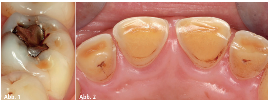
Abb. 1: Muldenförmiger Zahnhartsubstanzverlust an den Höckerspitzen eines Molaren. – Abb. 2: Erosiver Zahnhartsubstanzverlust an den Palatinalflächen der Oberkieferfrontzähne.

Mundhygienemaßnahmen können das Voranschreiten von Erosionen sowohl positiv als auch negativ beeinflussen, wobei die positiven Effekte potenzielle Nebenwirkungen bei Weitem übersteigen. Die Anwendung von Fluoriden hat nicht nur eine kariespräventive