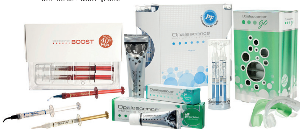
Abb. 1: Die Opalescence®-Produkte von Ultradent Products bieten je nach Wunsch und Indikation das Passende – ob kosmetische bzw. medizinische Zahnaufhellung oder unterstützende Zahncremes.

Das auf dem Wirkstoff Carbamidperoxid basierende Präparat Opalescence PF 10% (entspricht 3,6% H_2O_2 ) bzw. 16% (entspricht 5,8% H_2O_2 ) ist dagegen besonders empfehlenswert für Fälle, bei denen die Wirkstoffkonzentration individuell angepasst werden soll. Die Gele sind in zwei Konzentrationen und drei Geschmacksrichtungen erhältlich und werden mit individuell angepassten