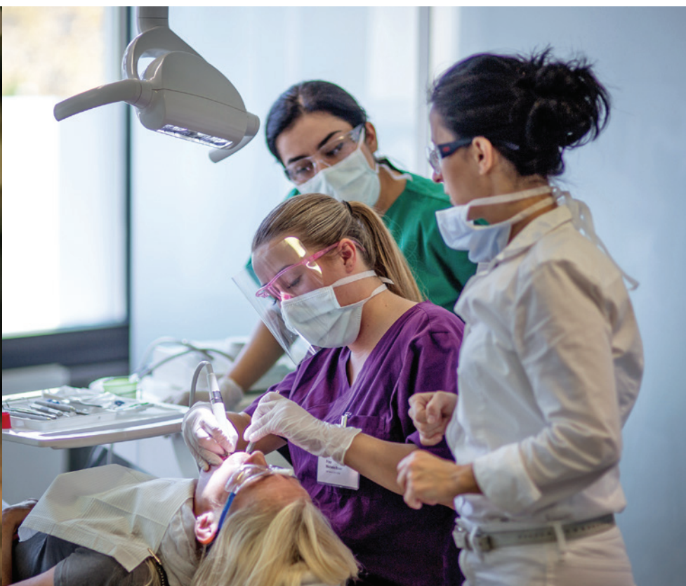
Abb. 2: An der Medical School 11 i. Gr.* gehen Praxis und Theorie für die angehenden Dentalhygienikerinnen Hand in Hand.

gezeigt, dass die ZMP-Aufstiegsfortbildung hervorragend auf das Studium vorbereitet.