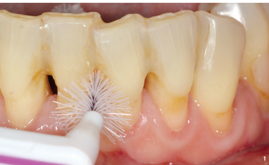
Abb. 1: Anpassung des passenden Interdentalraumbürstchens im Bereich einer Verblockung im Unterkieferfrontzahnbereich.

traumatische Okklusion zählen. In einigen Fällen kann diese erhöhte Zahnbeweglichkeit durch systematische Parodontistherapie und Korrektur von okklusalen Vorkontakten deutlich reduziert oder sogar beseitigt werden. Häufig jedoch verbleibt auch nach erfolgreicher Parodontistherapie und bei stabilen parodontalen Verhältnissen eine erhöhte Beweglichkeit, die durch die irreversible Verschiebung des Rotationszentrums des Zahnes bedingt ist. Patienten mit einer pathologisch erhöhten Zahnbeweglichkeit und sekundärem okklusalem Trauma, bei denen