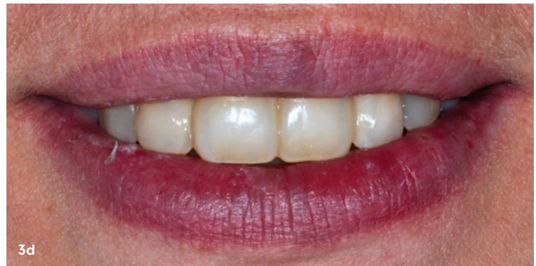
Abb. 3a-d: Klinisches Erscheinungsbild zwei Jahre nach aktiver Parodontistherapie (2021), (a) Frontalansicht. Im Unterkiefer wurden die Zähne 33–43 mittels Komposit und Glasfaserstrang verblockt. Die Oberkieferfrontzähne 12–22 wurden ebenfalls miteinander verblockt und die vorhandenen Lücken im Sinne einer direkten Formkorrektur geschlossen; (b) Detailaufnahme der Unterkieferfrontzähne von inzisal mit eingebrachter Verblockung; (c) Detailansicht der Oberkieferfrontzähne nach Zahnformung; (d) extraorales Lippenbild beim Lächeln. Die massiven Attachmentverluste im Unterkiefer sind im Alltag nicht sichtbar und stören die Patientin nicht. Eine Hypersensibilität der freiliegenden Zahnhälse ist nicht vorhanden.

Dies ist besonders bei großen freien Interdentalräumen der Fall. Um den parodontalen Therapieerfolg langfristig zu sichern und Karies zu vermeiden, ist nach Einbringen der Schienung eine korrekte Anpassung der Interdentalraumbürstchen für jeden Zwischenraum und die entsprechende Instruktion des Patienten unerlässlich (Abb. 1).