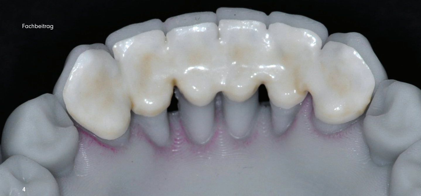
Abb. 4: Im 3D-Drucker hergestellte Schienung aus ZrO_2 .

ebenfalls eine Verblockung der Oberkieferfrontzähne und Zahnumformung im direkten Verfahren mittels Komposit. Abbildungen 3a–d zeigen die Situation der Patientin zweieinhalb Jahre nach Erstbefundung.