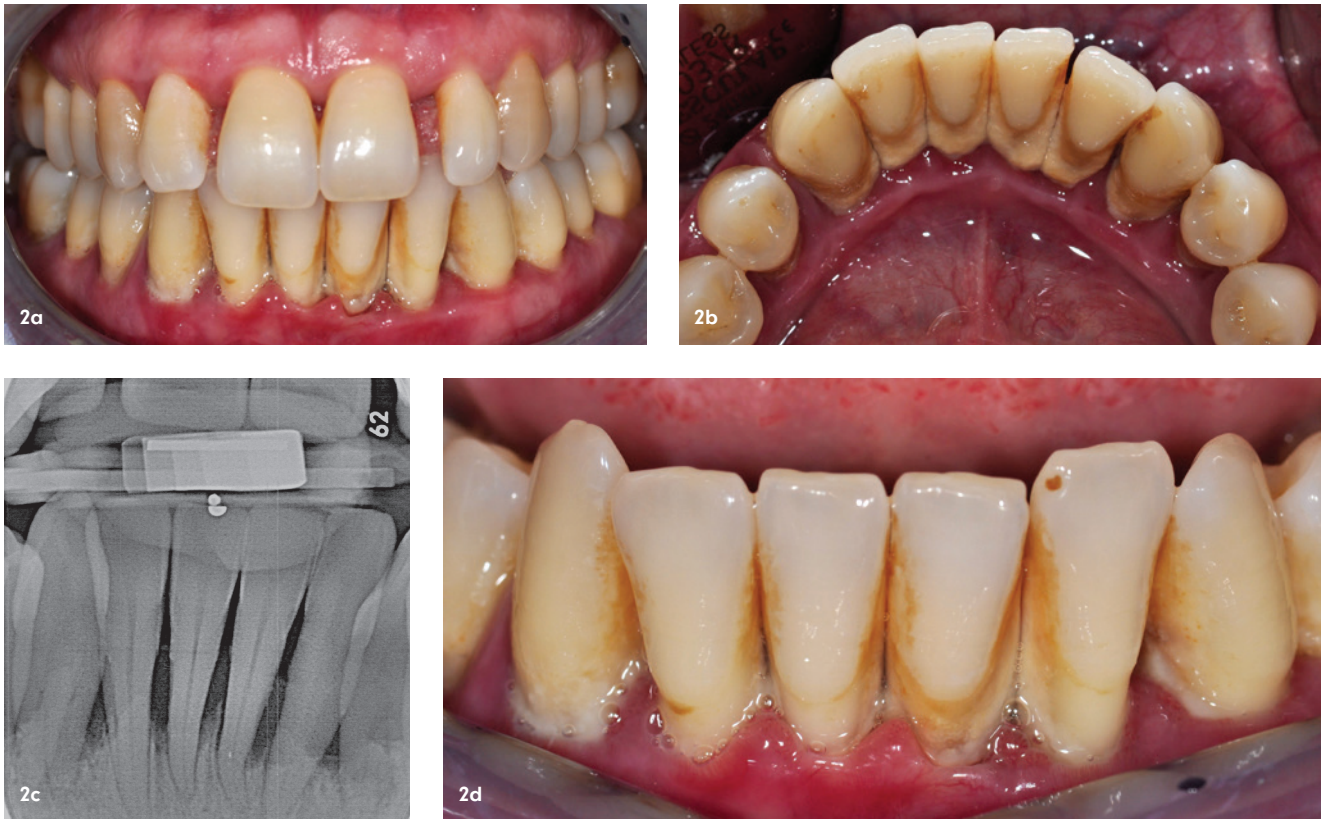
Abb. 2a–d: Klinisches Erscheinungsbild bei Eingangsbefund (2018), (a) Frontalansicht, (b+d) Detailaufnahme der Unterkieferfrontzähne von inzisal und vestibulär mit massiven harten und weichen Beläge, sowie Pusaustritt aus den Parodontien, (c) Die Zahnfilmaufnahme 33–43 zeigt bis zu 85 Prozent horizontalen Knochenverlust.

Korrekturen durch Schienungsmaßnahmen möglich sind, werden einer eigenen Kategorie des Stadium IV der Parodontitis zugeschrieben, dem sogenannten Falltyp 1. 6