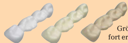
Aus IPS e.max ZirCAD Colour Blocks hergestellte Gerüste.

Die IPS e.max ZirCAD Colour Blocks werden im inLab-System von Sirona verarbeitet. Die Colour Blocks gibt es in zwei Farben (MO 1 und MO 2) und sechs Größen. Sie sind ab sofort erhältlich. ZT