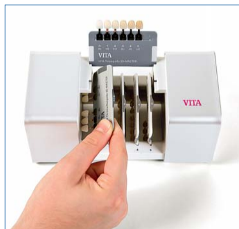
Bei der Farbbestimmung mit dem VITA Linearguide 3D-MASTER wird zunächst die Helligkeit bestimmt ...

VITA Zahnfabrik H. Rauter GmbH & Co. KG Spitalgasse 3 79713 Bad Säckingen Tel.: 0 77 61/5 62-0 Fax: 0 77 61/5 62-2 99 E-Mail: info@vita-zahnfabrik.com www.vita-zahnfabrik.com