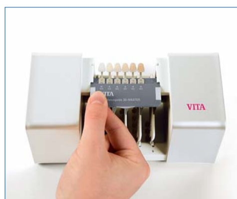
... und dann werden Intensität und Farbton festgelegt.

gelegt. Die Praxis hat jedoch bewiesen, dass Zahnmediziner und Zahntechniker, die über weniger Erfahrung mit der Farbbestimmung bzw. Wissen über die physikalischen Hintergründe verfügen, Schwierigkeiten mit dieser Methode haben. Zudem wird die hohe Anzahl von Farbmustern, die gleichzeitig wahrgenommen wird, teilweise als verwirrend empfunden.