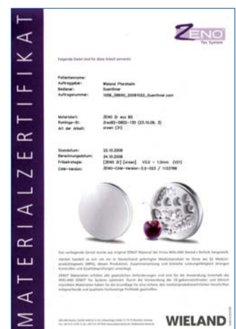
Das ZENO® Materialzertifikat erhöht die Qualitätssicherheit und erleichtert das Qualitätsmanagement in Praxis und Labor.

Informationen zu der individuellen Patientenversorgung vermerkt: Neben dem Patienten-