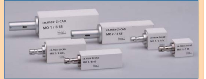
IPS e.max ZirCAD Colour Blocks: die voreingefärbten Zirkoniumdioxid-Blöcke.

gelehnt. Dabei unterstützt die Grundfarbe des Gerüsts das ästhetische Verblendresultat optimal – insbesondere bei Kombinationsarbeiten aus Lithiumdisilikat und Oxidkeramik.