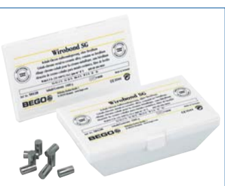
Der Verzicht auf Edelmetalle und die daraus resultierende Biokompatibilität kennzeichnen die neue Premium-Legierung von BEGO.

Wirobond® SG ist nickel- und berylliumfrei und besonders attraktiv im Preis, da diese edelmetallfreie Kronen- und Brücken-Legierung in einem optimierten Herstellverfahren legiert wird. Die Biokompatibilität von Wirobond® SG wurde durch ein neutrales Institut untersucht und bestätigt. Ein Bio-Zertifikat für diese Legierung liegt vor und bedeutet so Sicherheit für Zahnarzt und Patienten. Wirobond® SG überzeugt in der Verarbeitung und der