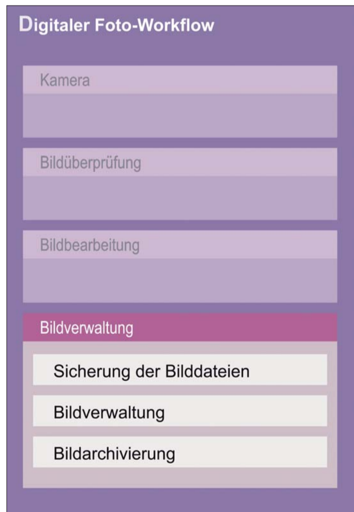
Abb. 1: Verwaltung des Bildbestandes im digitalen Foto-Workflow.

Die EXIF-Daten beinhalten die technischen Aufnahme-daten, die bereits von der Digitalkamera in den Kopfbereich (engl. Header) der Bilddatei gespeichert werden. Die EXIF-Daten sind sehr umfangreich und können von den Kamera-Herstellern noch um Zusatzinformationen erweitert werden. Die EXIF-Daten werden ebenfalls von der RAW-Konverter-Software für Optimierungszwecke herangezogen.