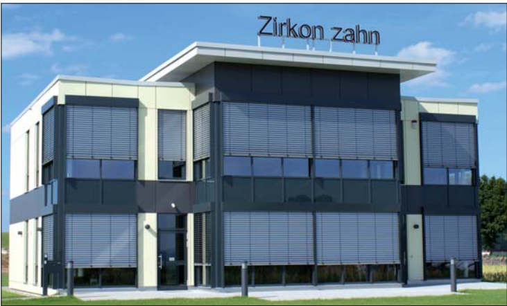
Zirkonzahn Education Center in Neuler bei Ellwangen.

In Deutschland steht das Zirkonzahn Education Center in Neuler bei Ellwangen. Trainings bieten auch die Zirkonzahn Education-Partner Wandtke Dental Technik in Lüneburg und Jochen Essl Zahntechnik in Bottrop an. Termine und Infos unter www.zirkonzahn-education.com