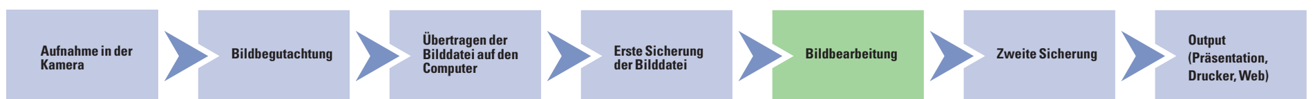
Prozess Bildbearbeitung innerhalb eines gegebenen Foto-Workflows.

Ebenen stellen das wichtigste und mächtigste Werkzeug überhaupt in der digitalen Bildbearbeitung dar. Man kann sich eine Ebene als Folie vorstellen, die einfach über ein Bildelement gelegt werden kann. Es können dann viele Ebenen, in denen jedes Mal bestimmte Korrekturen (man wendet z.B. einen Farbfilter auf einer Ebene an) durchgeführt werden können, übereinander gelegt werden. Ebenen können Bilddaten oder aber auch Einstellungen enthalten. So richtig mächtig werden Ebenen, wenn man sogenannte „Ebenen-Masken“ verwendet. Mit Ebenen-Masken können gezielt Bildteile ein- bzw. ausgeblendet werden. Mittels einer Ebenen-Maske lässt sich auch die Deckkraft zwischen 0 % (volle Transpa-