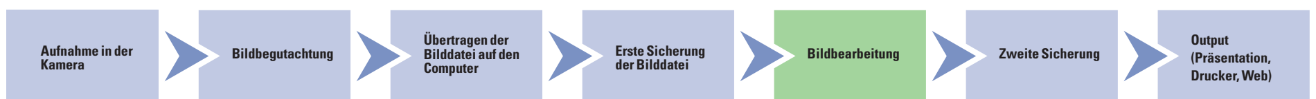
Prozess Bildbearbeitung innerhalb eines gegebenen Foto-Workflows.

Ebenen stellen das wichtigste und mächtigste Werkzeug überhaupt in der digitalen Bildbearbeitung dar. Man kann sich eine Ebene als Folie vorstellen, die einfach über ein Bildelement gelegt werden kann. Es können dann viele Ebenen, in denen jedes Mal bestimmte Korrekturen (man wendet z.B. einen Farbfilter auf einer Ebene an) durchgeführt werden können, übereinander gelegt werden. Ebenen können Bilddaten oder aber auch Einstellungen enthalten. So richtig mächtig werden Ebenen, wenn man sogenannte „Ebenen-Masken“ verwendet. Mit Ebenen-Masken können gezielt Bildteile ein- bzw. ausgeblendet werden. Mittels einer Ebenen-Maske lässt sich auch die Deckkraft zwischen 0 % (volle Transpa-