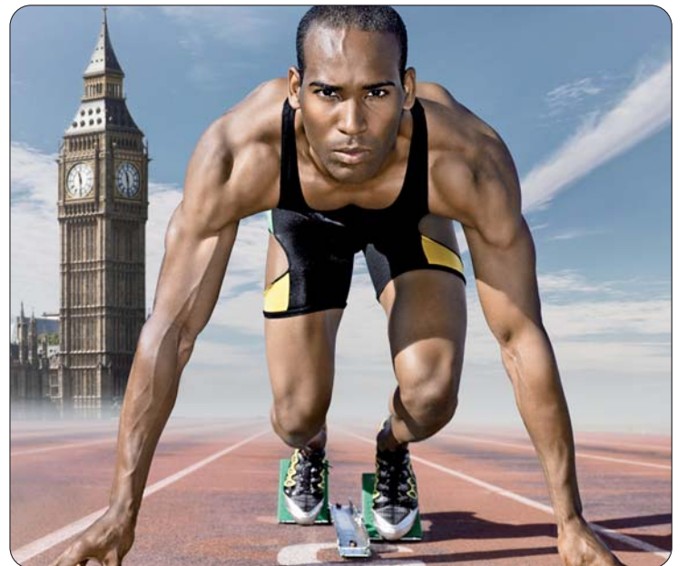
Auf die Plätze – fertig – BEGO: Auch in London 2012 geht das Bremer Dentalunternehmen wieder als offizieller Co-Partner der deutschen Olympia-Mannschaft an den Start.