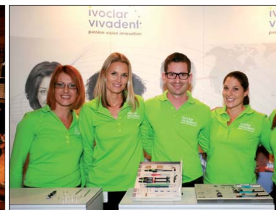
Das Team der Ivoclar Vivadent.

Höckerersatz bis zur direkten Krone“ zeigte er auf, was bei korrektem Materialeinsatz mit modernen Composites heute möglich ist; dabei wurde vor allem das neue Tetric EvoCeram Bulk Fill von Ivoclar Vivadent hervorgehoben.