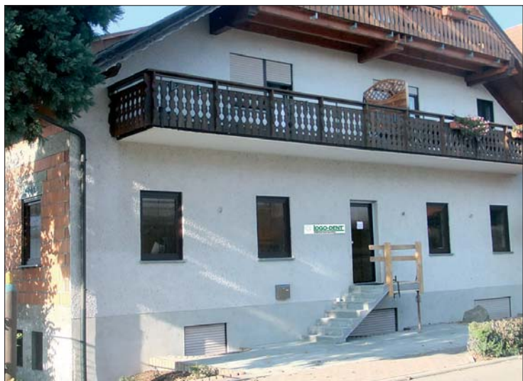
Das neue im Landhausstil gehaltene Büro- und Versandgebäude ermöglicht einen optimalen Service für die Dentallabore.

Mit dem Umzug hat sich nur die postalische Adresse von