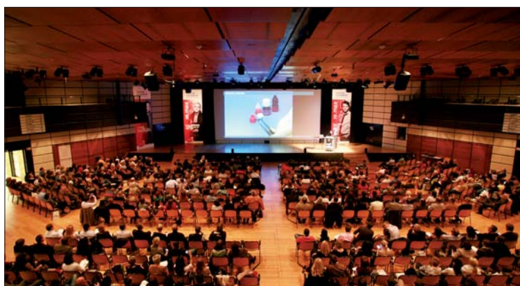
Ein voller Vortragssaal auf dem 3. Competence in Esthetics in Wien.