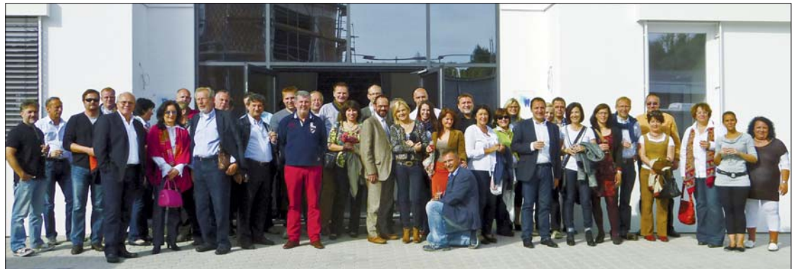
Mitglieder der CompeDent beim CompEvent 2012 in Nürnberg.