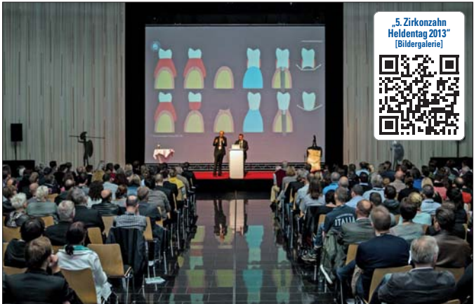
Mehr als 400 Teilnehmer besuchten die Veranstaltung.