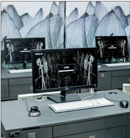
Das neue Mobile Labor.

Mitte der Molaren ein. Die Vielfältigkeit des Prettau® Zirkon demonstrierte der französische Zahntechniker Jean-Pierre Le Vot im zweiten Vortrag des Vormittages. Er stellte drei Patientenfälle mit Totalrehabilitationen auf Implantaten mit unterschiedlichen Konzeptionen vor: zementiert, verschraubt und teleskopiert. Beschrieben wurden die einzelnen Fertigungsschritte einer Prettau®-Brücke