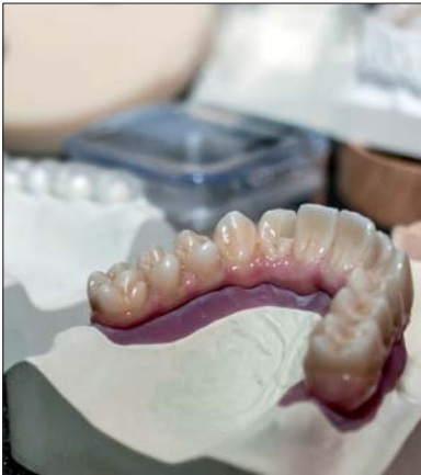
Zirkonzahn-Produkte zum Anfassen.