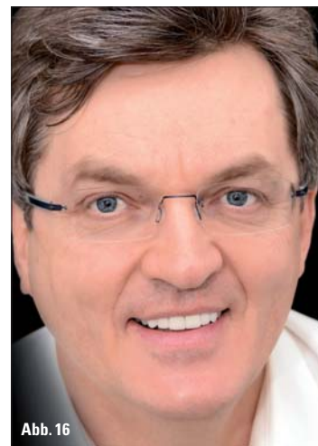
Abb. 16: „Ästhetik folgt Funktion“ – das Weichgewebeprofil des Mittelgesichts hat sich durch die Bisshebung enorm verändert. Der Gesichtsausdruck des Patienten zeigt seine Zufriedenheit mit dem Ergebnis.

müssen auch ästhetisch keinerlei Kompromisse eingegangen werden. Der Patient war aufgrund der therapeutischen Schienentherapie an die „neue“ vertikale Bisslage gewöhnt und fühlte sich funk-