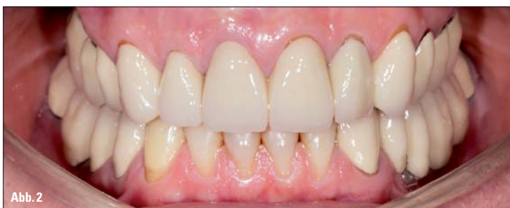
Abb. 2: Intraorale Diagnose: starke Gingivarezessionen an den vorhandenen keramischen Versorgungen.

der Vorgeschichte wurden die patientenspezifischen Parameter erfasst (röntgenologisch, fotografisch, klinisch). Das Mittelgesicht war leicht komprimiert, was auf eine reduzierte Vertikaldimension hinwies (Abb. 1a und b). Auf dem Lippenschlussbild waren die dafür bezeichnenden, nach kaudal zeigenden Mundwinkel erkennbar. Die intraorale Analyse zeigte Gingivarezessionen, einen mangelnden Freiraum in der zentrischen Okklusion sowie eine unzureichende Passgenauigkeit der Restaurationen (Abb. 2). Der Patient war mit zusammengefügtten VMK-Kronen auf natürlichen Pfeilerzähnen sowie auf Implantaten versorgt. Die Inzisalkante