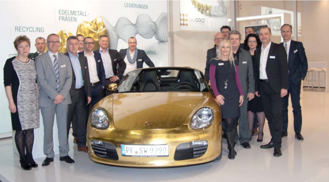
Die C.HAFNER-Mannschaft steht geschlossen für Gold in der Zahnmedizin.

gierungen im Edelmetallbereich und, immer häufiger nachgefragt, auch Anlagegold in Form eigener formschöner Barren in zahlreichen Stückelungen. Nicht unerwähnt bleiben soll in diesem Zusammenhang die Zertifizierung durch die London Bullion Market Association, die