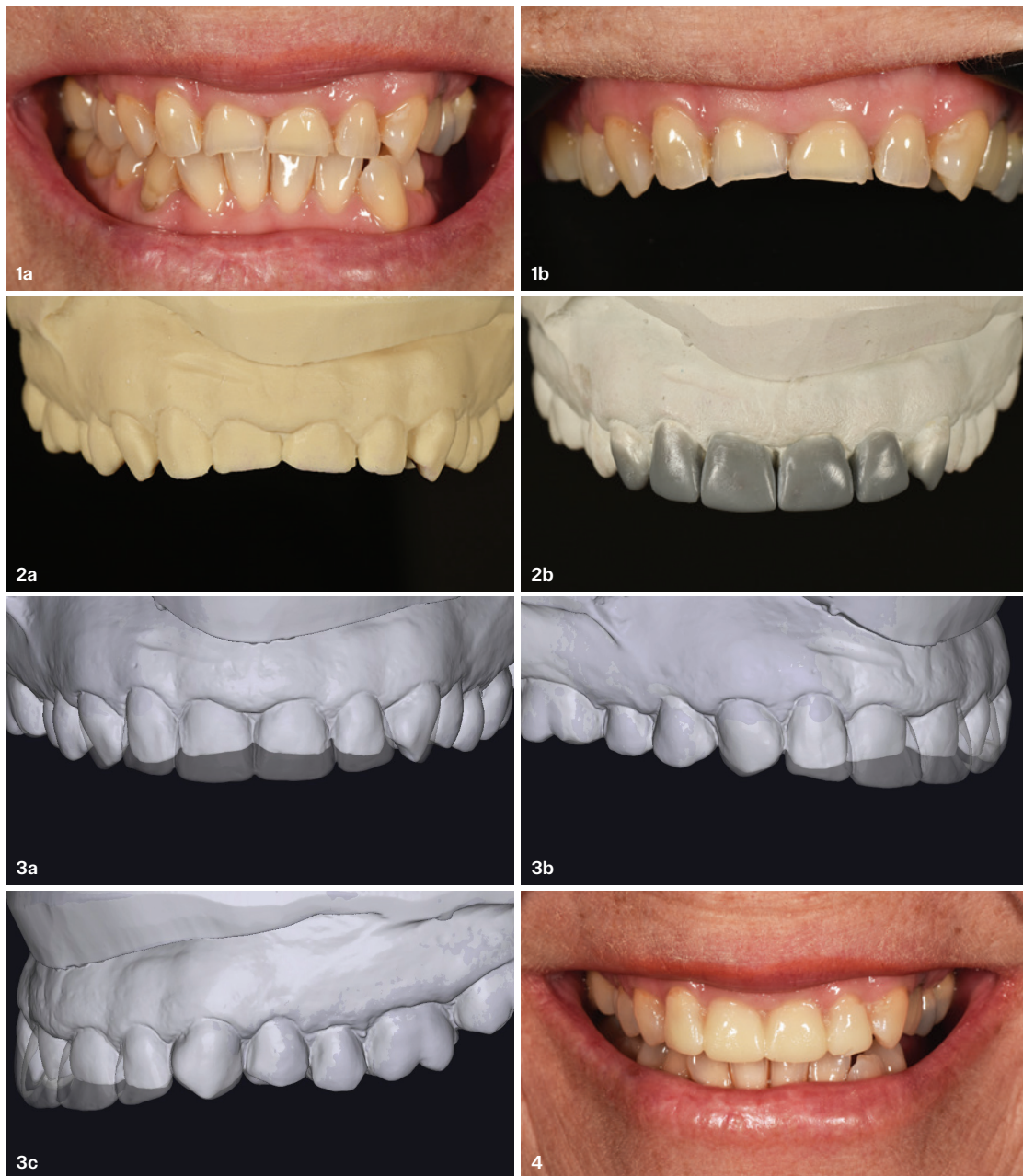
Abb. 1a+b: Ausgangssituation. – Abb. 2a: Initiales Modell. – Abb. 2b: Wax-up. – Abb. 3a–c: Wax-up digitalisiert und überlagert mit Ausgangssituation. – Abb. 4: Mock-up übertragen.

Die moderne Zahnmedizin stellt hohe Anforderungen an Funktion und Ästhetik, besonders im sichtbaren Frontzahnbereich. Patienten wünschen sich nicht nur gesunde, sondern vor allem natürlich wirkende und langlebige Versorgungen, die ihr Lächeln optimal in Szene setzen. Der vorliegende Fall zeigt, wie durch sorgfältige Planung, den Einsatz bewährter Techniken und moderner digitaler Hilfsmittel eine komplexe Rehabilitation von Frontzähnen erfolgreich umgesetzt werden kann. Dabei wird deutlich, wie wichtig die enge Zusammenarbeit zwischen Zahnarzt, Labor und Patientin ist, um individuelle Erwartungen präzise zu erfüllen und ein harmonisches Ergebnis zu erzielen.