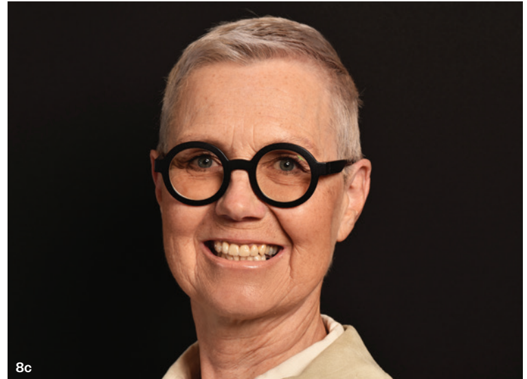
Abb. 8a: Porträt Ausgangssituation. – Abb. 8b: Porträt Mock-up. – Abb. 8c: Porträt der finalen Arbeit.